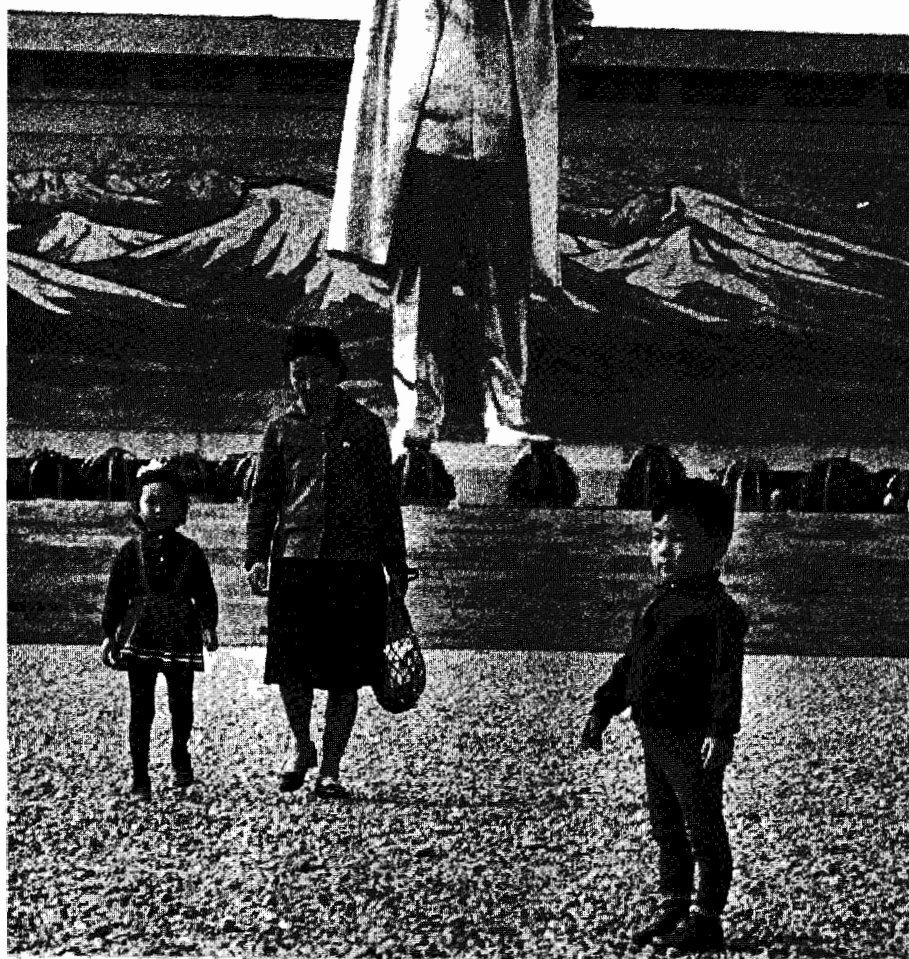
Το άγαλμα του Κιμ Ιλ Σουνγκ, ύψους 25 μέτρων, στο Μεγάλο Μνημείο Μασουναντέ, ανεγέρθηκε το 1972, για τον εορτασμό των εξηκοστών γενεθλίων του «Μεγάλου Ηγέτη».