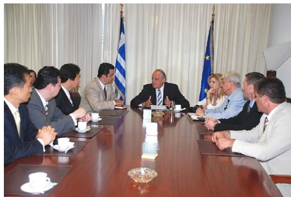
Τρίτη 21 Αυγούστου, μεγάλα σχέδια λίγο πριν την Καταστροφή

Το ενδιαφέρον της Αμερικανικής Υψηλόβαθμης Αντιπροσωπείας υπήρξε δεδομένο , όπως και οι διαβεβαιώσεις για κάθε σχετική βοήθεια από τον Περιφερειάρχη!